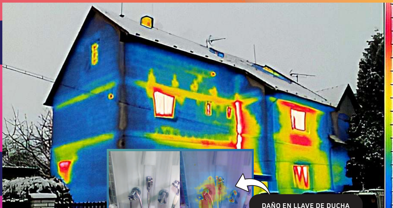
DAÑO EN LLAVE DE DUCHA

Son muchos los usos importantes que tiene este servicio en diferentes áreas y problemas, como la evaluación de fugas de aire en cuartos fríos o la identificación de fugas de gas.